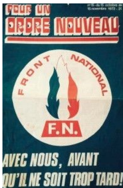
Слева: логотип MSI 1947-1972 годы; справа: первые плакаты FN в 1972 году, финансируемые MSI

Связи между MSI и НФ подтверждаются и на уровне символов: НФ принял трёхцветное пламя в качестве своего логотипа, разделяя наследие итальянской партии и идеологию. Прежде всего, пламя символизирует принадлежность к определённой фашистской мистике: официально аббревиатура MSI означает «Movimento Sociale Italiano», «Итальянское социальное движение», но посвящённые расшифровывают аббревиатуру «Mussolini Sempre Immortale» — «Муссолини всегда бессмертен». Основание же представляет могилу Муссолини в Предапписо (Predappio), а пламя — его вечное возрождение 26 .