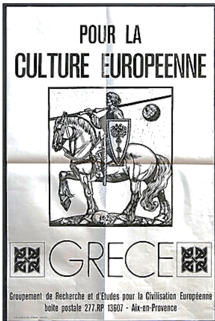
Слева вверху: логотип «Студенческого действия». Слева внизу: логотип «Центра изучения Пино Раути». Справа: логотип GRECE в 1960-х годы.